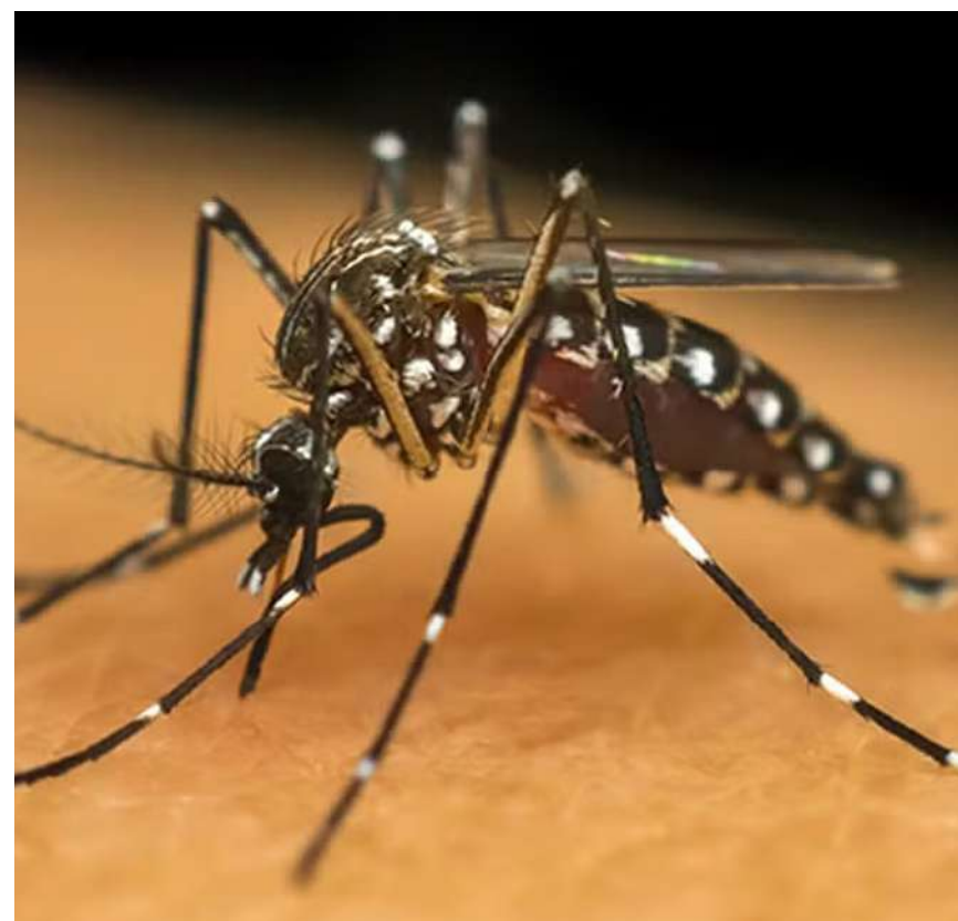
Em fevereiro, houve aumento de 295% no número de infectados e de 425% no número de mortes