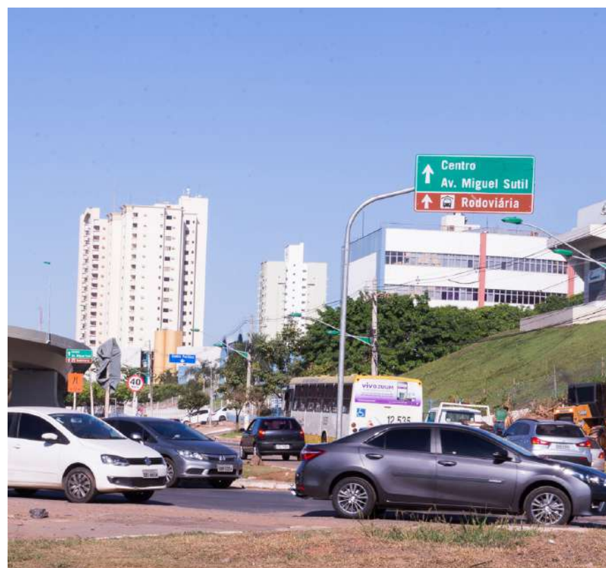
Os contribuintes podem pagar o imposto à vista, garantindo descontos progressivos de 5% ou 3%, ou optar pelo parcelamento em até oito vezes consecutivas

Caso o pagamento não seja realizado dentro do prazo, pode resultar em multas, juros e outras penalidades que podem dificultar a regularização do automóvel.