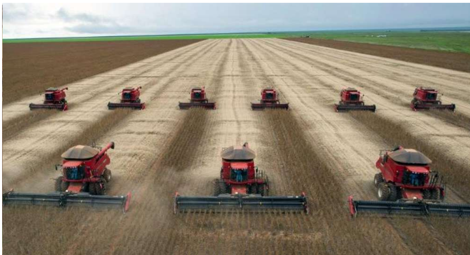
Equipes já percorreram mais de 31 mil quilômetros, abrangendo 88 municípios produtores de soja, que juntos representam uma área de 11 milhões de hectares.