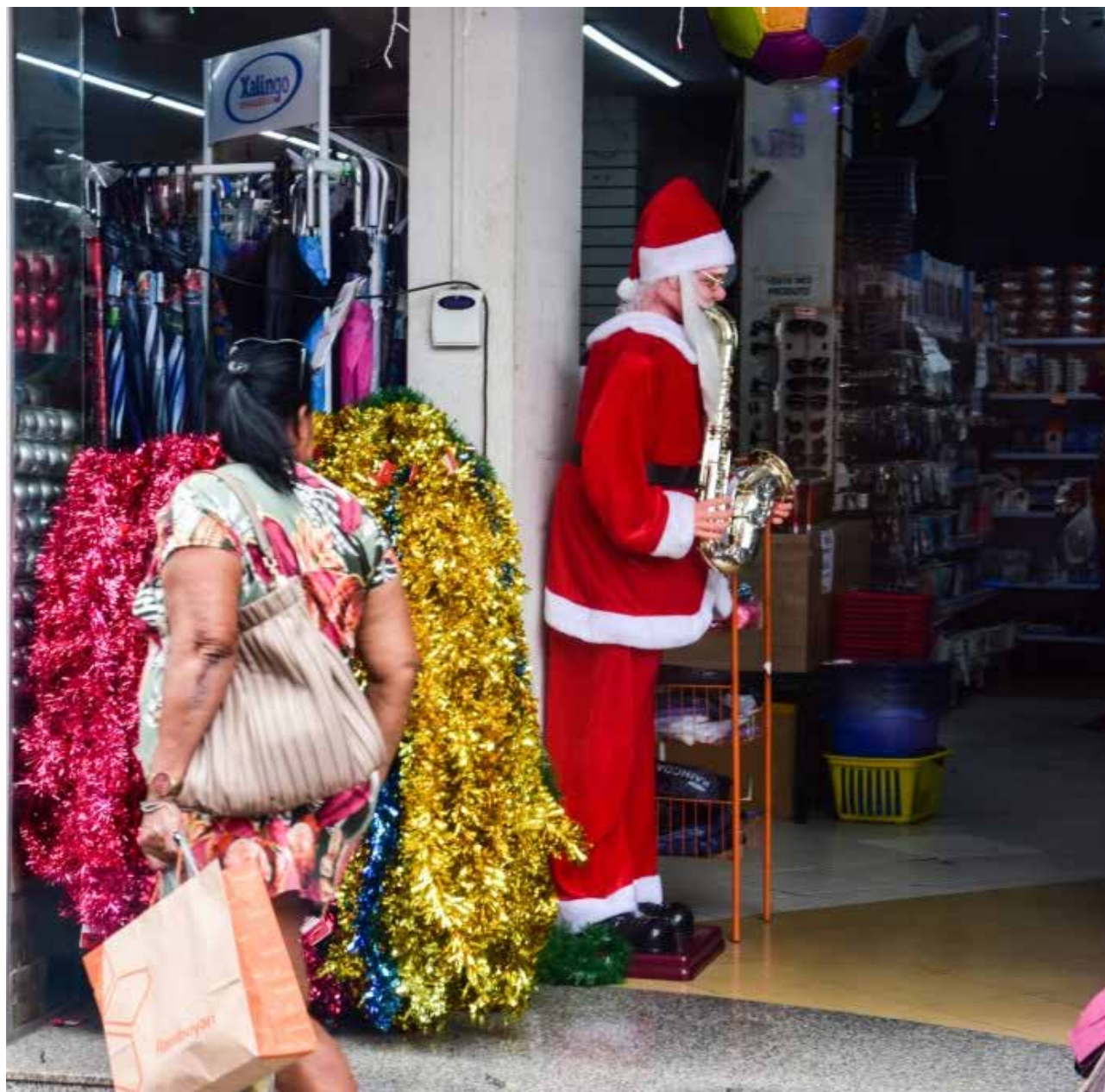
A média de gastos aumento, passando de R$ 500 em 2024 para R$ 759,79 em 2025, uma variação real de 45,16%

Pesquisa aponta que 35,9% dos entrevistados devem comprar roupas e acessórios