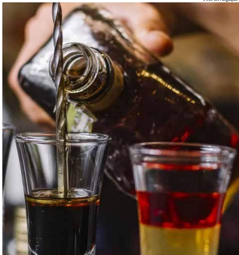
A população deve sempre verificar rótulo, lote e data de fabricação antes de consumir bebidas alcoólicas