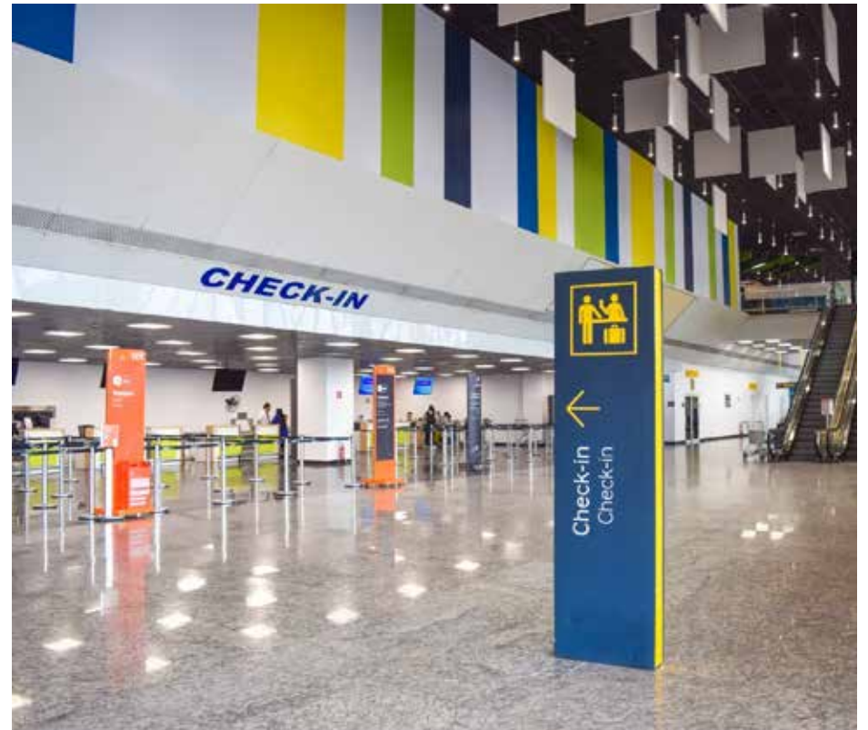
Empreendimento ocupa a 5ª posição no acumulado do ano e chegou à terceira posição na avaliação do último mês de novembro

Café, Pizza Crek, Brahma, Subway, Rei do Mate, Casa do Pão de Queijo, Louvada, Píticas e Nutty Bavarian.