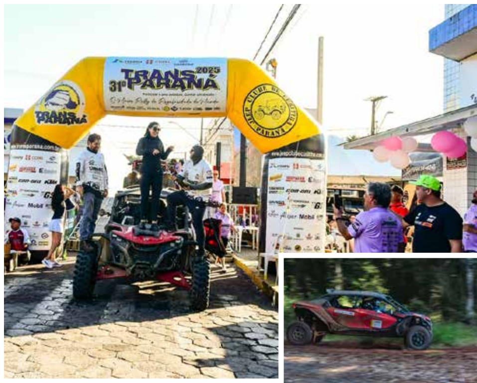
A competição, que reúne pilotos e navegadores de diversas regiões do país, exige precisão de navegação, controle rigoroso de médias e alto nível de resistência física e mental

A participação no rally paranaense também representa um momento importante de consolidação, ampliando experiência, ritmo de prova e integração entre piloto e navegador, fatores essenciais para desafios ainda maiores no calendário nacional.